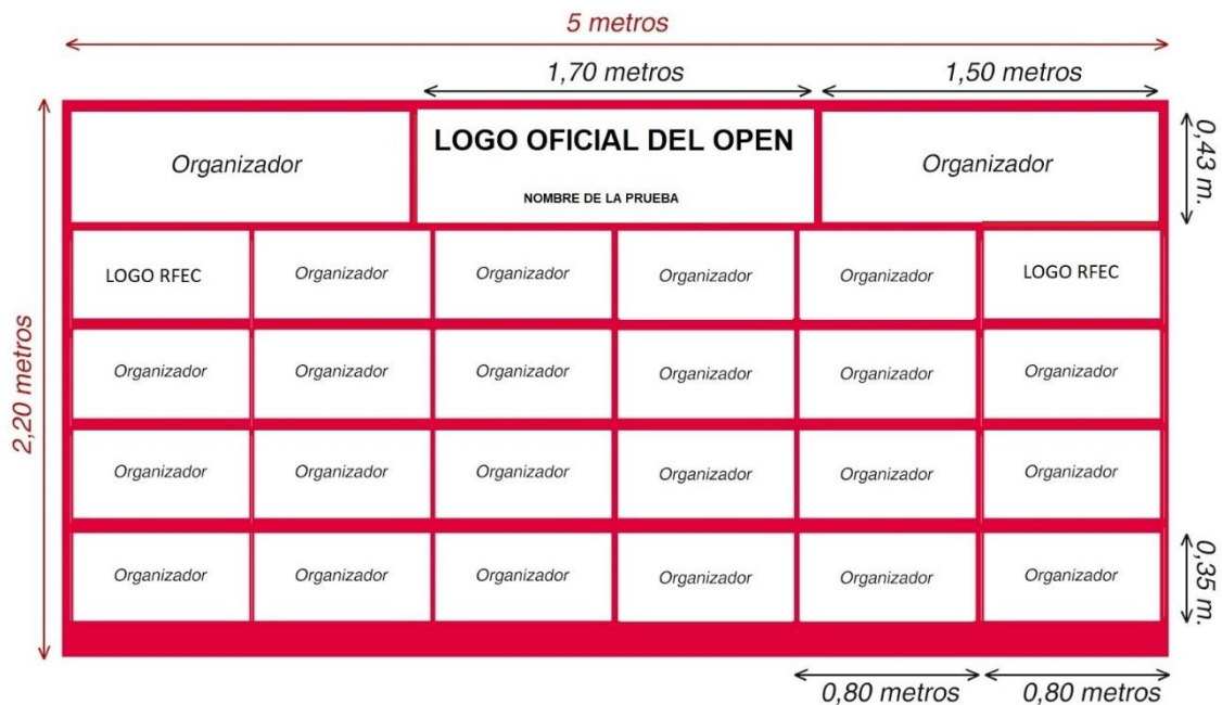
IMAGEN DEL PODIO. Crear la lona de podio con el diseño y medidas aproximadas de la siguiente imagen. El Organizador deberá enviar el diseño a la RFEC para su aprobación.

SEÑALIZACIÓN INFORMATIVA. Se establecerá una señalización vial en toda la zona del Open que informe, de forma permanente durante la duración del mismo, de los principales puntos de interés: oficina permanente, acceso a los recorridos, salidas de la ciudad, etc., contando y siendo única y exclusiva responsabilidad del Organizador el disponer de todos los permisos y autorizaciones que sean requeridos.