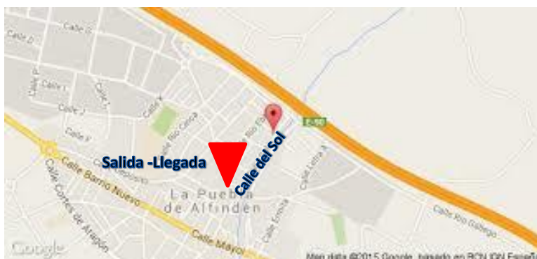
Plano de la zona urbana de salida y llegada de la etapa XCM

La salida es en la explanada de los almacenes viejos del trigo, sito en La Puebla de Alfindén, Calle del Sol, camino de Alfajarín, barranco de la Virgen, Primoral, Galacho de los Pinos, Campoliva, Palu, La Flora, Barranco del Salado, Las Gradetas, Barranco del Salado, Sabina, Cementerio de Villamayor, Valdeatalaya, (Avituellamiento) Collariza de San Juan, Paridera de la Pica, El realengo, Barranco de las Casas, Camino del Monte, (Avituellamiento), camino de Alfajarín, Barranco de Val del Olmo, Paridera de las Guardias, Caseta de los Cazadores, Barranco de las Casas, Valdesentir, Vial, Calle del Sol, (Meta)